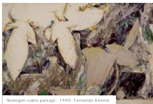
'Bodegón sobre paisaje', 1990. Fernando Almela