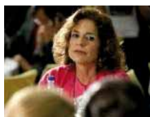
Ana Botella anuncia una rebaja de los impuestos municipales