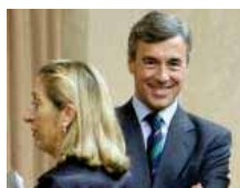
IU amplía su querrela del 'caso Bárcenas'