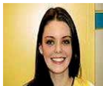
Brackets zirconio 480€

Dto. 60%. Brackets última generación: más resistentes, cómodos y estéticos, apenas se notan!