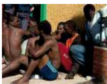
Ceuta traslada a los inmigrantes a la península por el colapso del CETI