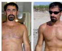
Los Médicos se sorprenden!

Dto. 60%. Brackets última generación: más resistentes, cómodos y estéticos, apenas se notan!