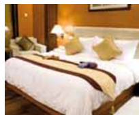
Hotel de lujo desde 30€

Aprende a utilizar uno de los mejores programas de diseño gráfico. ¡Tablet GRATIS de regalo!