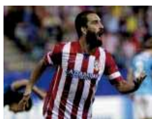
Arda Turan amplía su contrato con el Atlético hasta 2017