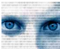
Curso PhotoShop CS5

Un padre de Sevilla perdió 12 kg en 4 semanas gracias a este método creado por científicos estadounidenses.